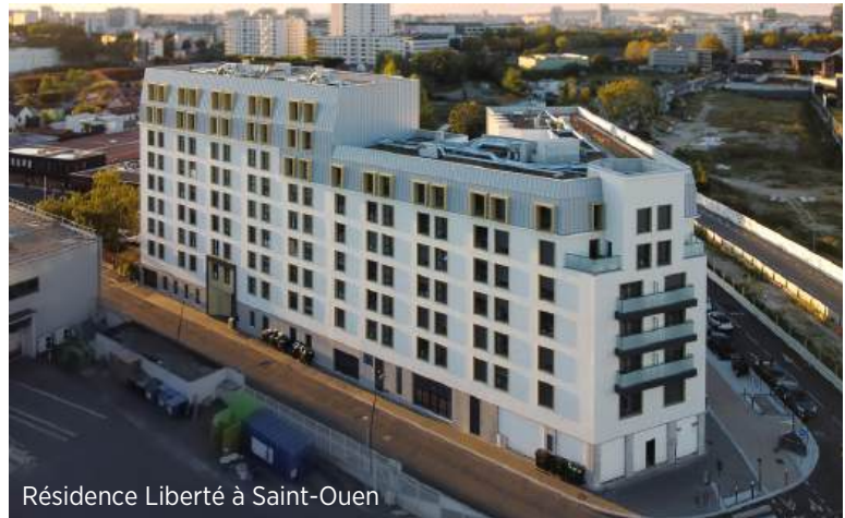
Résidence Liberté à Saint-Ouen

Si l'université est locataire d'un certain nombre de logements, la fondation a investi dans deux résidences – Arena à Nanterre et Liberté à Saint-Ouen-sur-Seine – dédiées aux étudiants Dauphinois, français et internationaux. Financées à 100 % par la fondation, elles illustrent parfaitement son engagement profond pour les étudiants et l'égalité des chances.