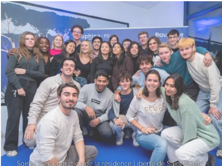
Soirée d'inauguration de la résidence Liberté de Saint-Ouen

Désormais, les deux nouvelles résidences comptent un total de 214 logements. Pour de nombreux étudiants, avoir accès à ces logements a été un véritable soulagement, facilitant leur intégration et leur réussite à Dauphine.